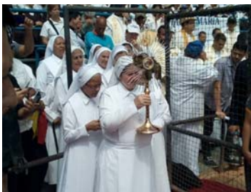
Traslado de las reliquias por las Siervas de Jesús en la ceremonia

El documento religioso firmado por el Papa Francisco; indica que cada 9 de mayo se celebrará en honor a su memoria; por ser el día en el que fue glorificada en el cielo.