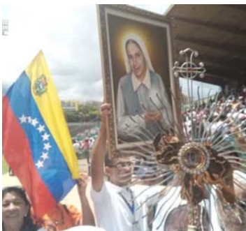
Multitudinario evento de fervor Religioso y júbilo por la nueva Beata